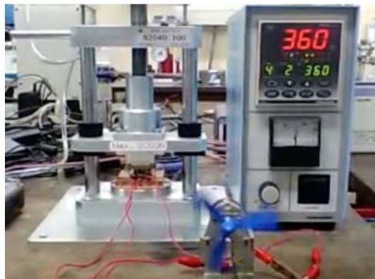
熱電モジュールの性能評価